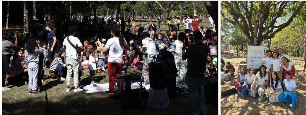
Figura 9: Piquenique musical

não se configura como um espetáculo, e sim como um momento de interação com as famílias. O domingo no Campus acontece uma vez por semestre, quando toda a comunidade é convidada a ocupar os espaços da universidade.