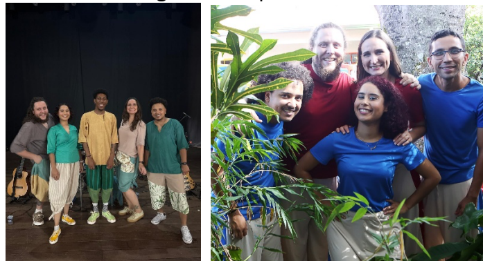
Figura 2: Grupo Bambulha

- Grupo Bambulha (banda) – formado, basicamente, pelos integrantes iniciais do projeto, contando com estudantes e egressos;