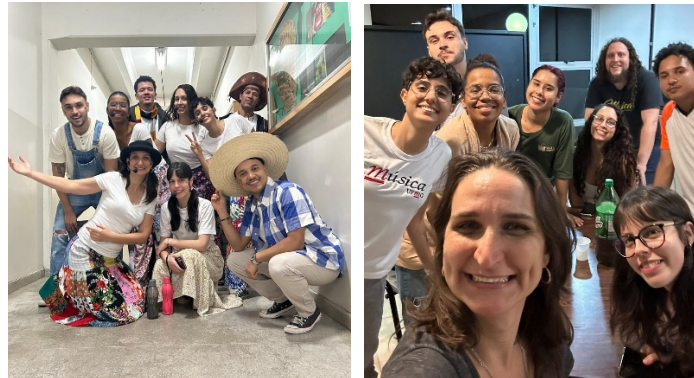
Figura 3. Bambulha Itinerante