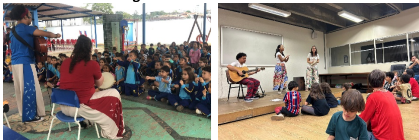
Figura 4: Bambulha Pocket

- Bambulha Pocket – formação reduzida, com trios ou duplas, que inclui os participantes das formações citadas acima em pequenos grupos, para ações específicas.