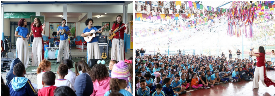
Figura 6: Bambulha nas escolas

- Apresentações musicais em escolas básicas e espaços diversos, como teatros, praças, espaços alternativos etc. As apresentações podem incluir espetáculos com a banda completa, com o Bambulha Itinerante ou com o Bambulha Pocket. O formato do grupo dependerá do espaço onde será realizada a apresentação, e do seu objetivo;