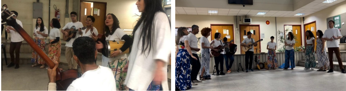
Figura 5: Disciplina Música Infantil e Produção Cultural

criação/composição de uma canção infantil e de uma performance artística;(4) Apresentação aberta ao público 1 .