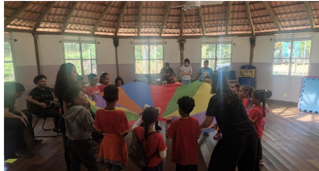
Figura 7: Oficinas musicais