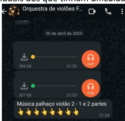
Fig. 3: Iniciativas de integrantes para ajudar os estudos individuais dos que tinham dificuldades em assimilação.