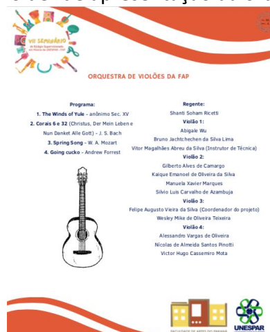
Figura 4: Folder de apresentação da orquestra