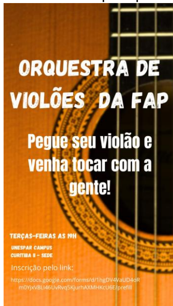
Figura 2: Chamamento para participar da orquestra.