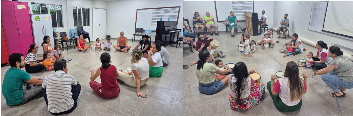
Figura III: Alunos, responsáveis e monitores na roda de música.