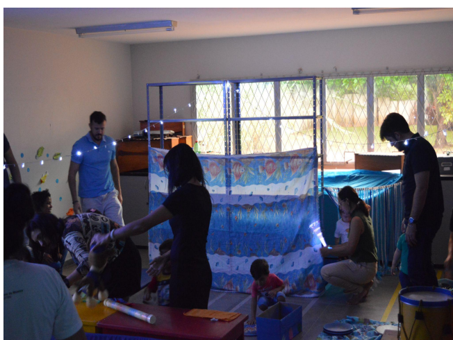
Figura IV: Crianças e responsáveis no espaço multisensorial.

Na saída do rio tinham luzes coloridas e um varal de fitas associando a cachoeira, prosseguindo para o mar. Lá encontrava-se uma caixa com cocos, ocean drum e uma “pista do mar” (apelido carinhoso dado pelo aluno R.): um tecido estendido no chão, no qual borrifamos água. As crianças podiam pisar e sentir o aspecto molhado. Nas margens, conchas e areia cinética.