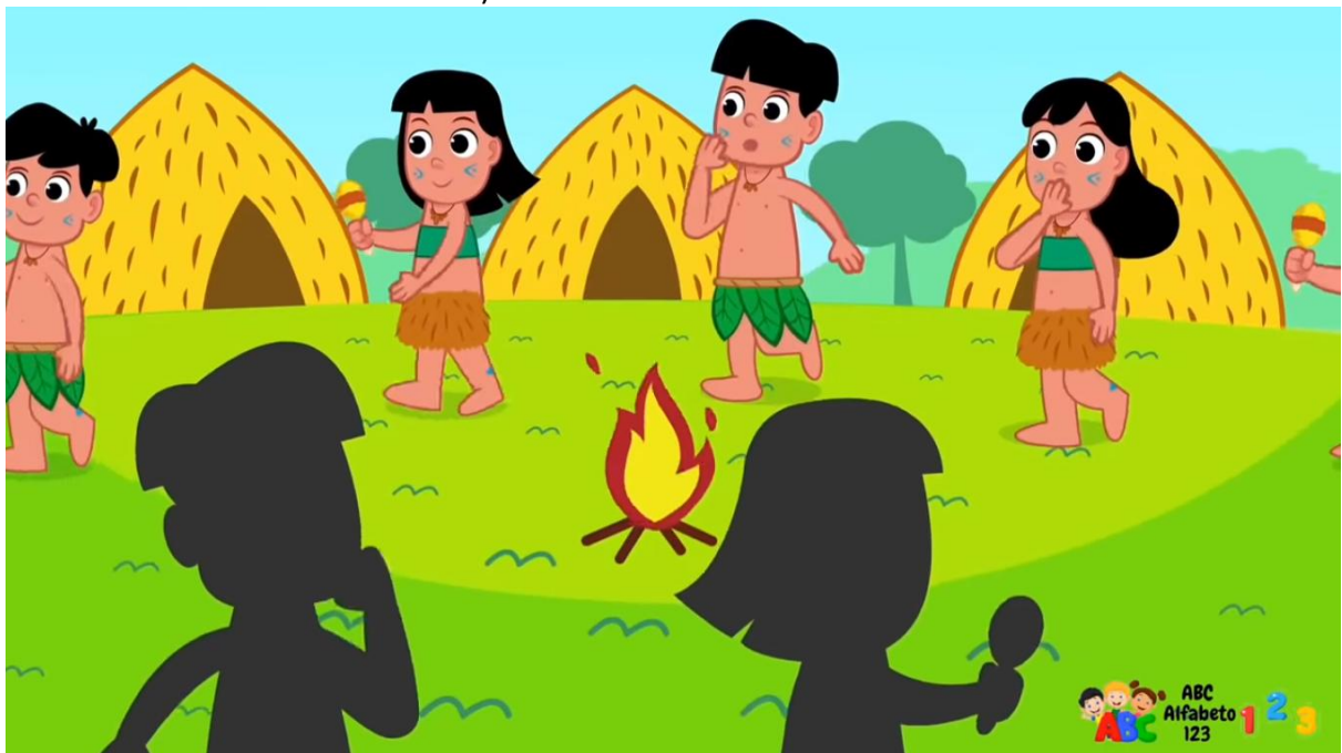
Figura 2. Printscreen do vídeo 1 (também presente no vídeo 2, sem a marcação específica do canal no canto inferior direito)

Em termos visuais, o primeiro e o segundo possuem o mesmo vídeo, sendo as animações edições de um outro vídeo 4 . Nesta animação, os indígenas são apresentados com características estereotipadas, como penas, pintura corporal, oca, dança em volta da fogueira e canto que bate a mão na boca.