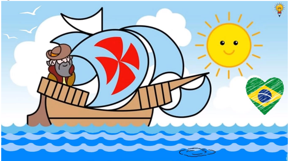
Figura 5. Printscreen do vídeo 3