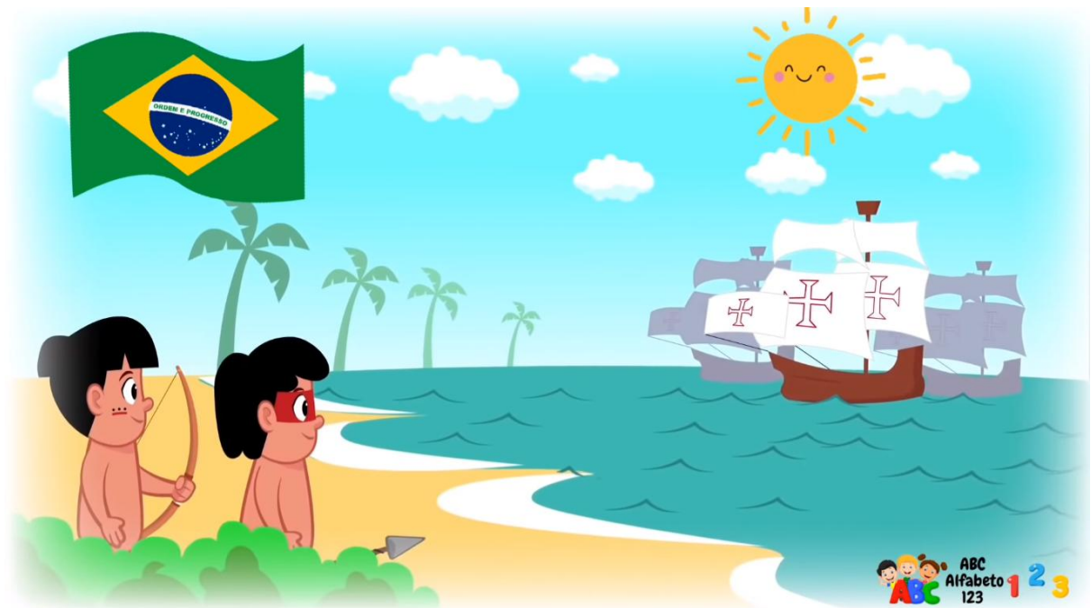
Figura 4. Printscreen do vídeo 1 (também presente no vídeo 2, sem a marcação específica do canal no canto inferior direito)

Em outro momento dos vídeos, também é possível ver como a relação inicial dos indígenas com os portugueses é retratada. No vídeo 1 e 2 aparece o seguinte: