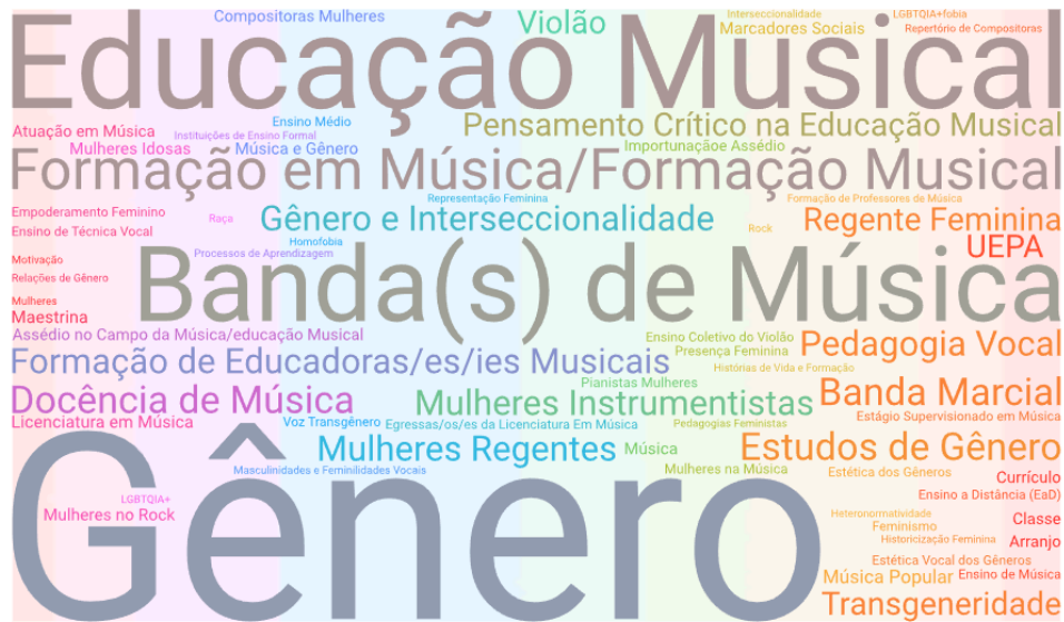
Figura 3: Nuvem de palavras-chave 4