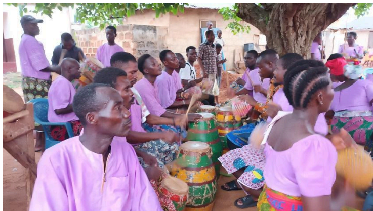
Figura 1: Gbolonyo Community.

Conforme apresentado no início do texto o objetivo deste trabalho é fazer uma análise dos saberes percussivos observados em campo a partir da minha pesquisa de pós-doutorado realizada no período de junho de 2024 até maio de 2025. No primeiro mês realizei um curso de especialização em “Estudos avançados na Música e Dança da África Oeste” realizado pela Nunya Academy Summer Institute (NASI 2024) sob a coordenação Dr. Kofi Gbolonyo. Neste período, pude vivenciar as metodologias de ensino dentro das oficinas, acessos aos grupos musicais da comunidade de Dzodze (Volta Region) e as atividades da escola de música Nunya Academy.