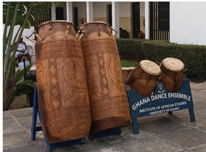
Figura 3: Fontromfoms (dois maiores) e Atumpan (dois menores) Fontromfrom. Grupo étnico: Akan .

Essa configuração para além de nos apresentar tanta diversidade nos ensina também sobre valorizarmos o entendimento da cultura como ferramenta essencial aos estudos das práticas percussivas, conhecendo com profundidade elementos que constroem desde a fabricação do instrumento como a sua técnica e produção sonora. Dessa forma, entendemos que esses aspectos são carregados por meios de conhecimentos que se configuram como saberes percussivos. Colocamos abaixo duas figuras que apresentam um exemplo dessa configuração instrumental a partir do seu grupo étnico específico: